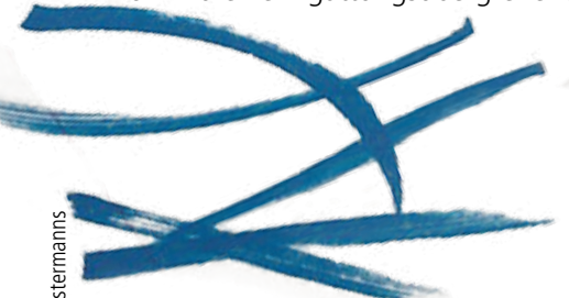
Detail grafische Notation © Johannes S. Sistermanns

Komposition und Ausstellung RAUM IST PARTITUR verbinden gegenwärtiges Komponieren, sechs aktuelle künstlerische Positionen bildender Künstler*innen und Mauricio Kagels Beethovenzimmer, das 1970 zum 200. Geburtstag von Ludwig van Beethoven als Filmkulisse zu „Ludwig van“ entstand, im Künstlerforum Bonn zu einem gattungsübergreifenden Projekt im Rahmen von BTHVN 2020.